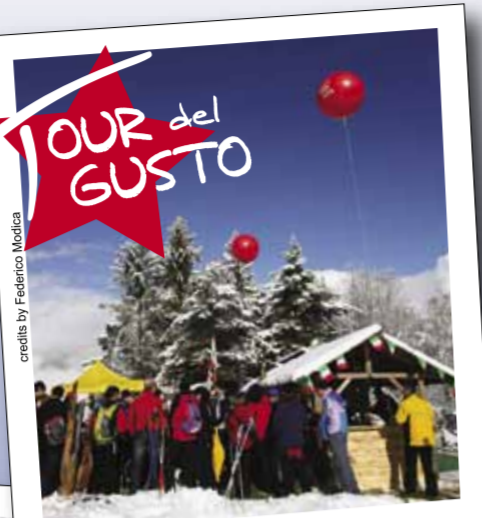
Tour del Gusto 2010