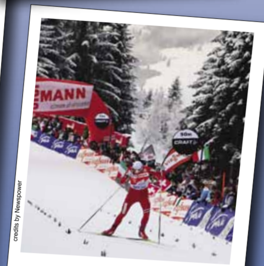
Tour de Ski 2010, arrivo