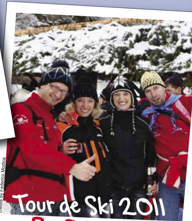
Tour de Ski 2011 8 e 9 gennaio Val di Fiemme