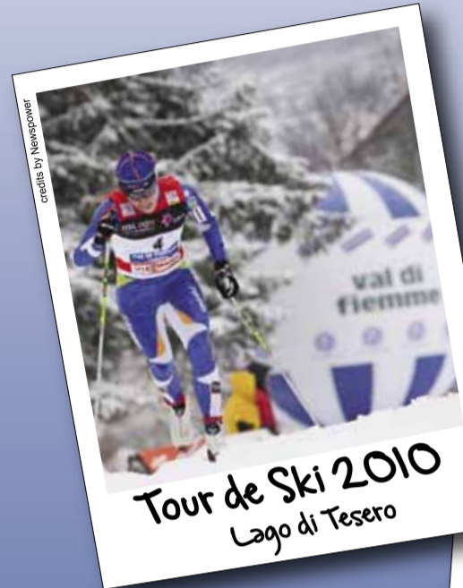
Tour de Ski 2010 Lago di Tesero

VIESSMANN FIB WORLD CUP CROSS-COUNTRY Tour de Ski performance by CRAFT SPORTSWEAR