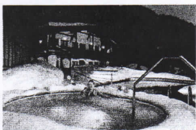
ALPIN WELLNESS HOTEL KRISTIANIA Via S. ANTONIO, 18 - COGOLO DI PEJO (TN) Tel. 0463.754157 - Fax 0463.746510 WWW.HOTELKRISTIANIA.IT

Quante cose racchiuse in una sola destinazione turistica. Siamo in Val di Sole, tra piste da sci che attraggono appassionati da ogni dove e una montagna incantata così ricca di scori naturalistici e sentieri da esplorare che non si esauriscono mai. E siamo anche a Pejo, dove la madre terra racchiude due fonti di acqua minerale tra le più pregiate, con un attrezzato stabilimento termale posto a circa 1.400 metri di altitudine. La nostra meta è l'Hotel Kristiania, una specie di istituzione da queste parti, principale struttura residenziale della valle, a Cogolo di Pejo, che è anche il centro delle attività sociali, economiche e culturali della città. Nel cuore delle Dolomiti, tra il profilo del Sassolungo e lo sguardo dominante del gruppo del Sella, in una posizione tranquilla, favorita da un clima soleggiato, si staglia questo imponente edificio, con un corpo principale e vari edifici di contorno. Atmosfera cordiale, ambienti accoglienti, quella sensazione di tranquillità fuori dal mondo che in Trentino quasi ovunque si riesce a respirare. Camere di differenti ampiezza e stile, predominanti legno e toni del bianco, a rendere ancora più personalizzata la vacanza degli ospiti. Servizi tutti di buon livello, con uno staff guidato con mano sicura da un management esperto. Che, da