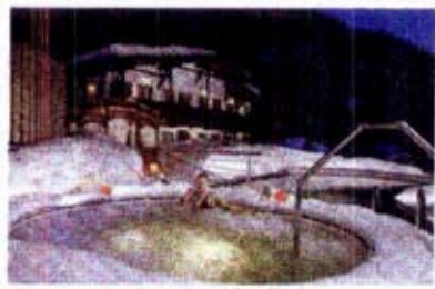
ALPIN WELLNESS HOTEL KRISTIANIA VIA S. ANTONIO, 18 - COGOLÒ DI PEJO (TN) TEL. 0463.754157 - FAX 0463.746510 WWW.HOTELKRISTIANIA.IT

Quante cose racchiuse in una sola destinazione turistica. Siamo in Val di Sole, tra piste da sci che attraggono appassionati da ogni dove e una montagna incantata così ricca di scorci naturalistici e sentieri da esplorare che non si esauriscono mai. E siamo anche a Pejo, dove la madre terra racchiude due fonti di acqua minerale tra le più pregiate, con un attrezzato stabilimento termale posto a circa 1.400 metri di altitudine. La nostra meta è l'Hotel Kristiania, una specie di istituzione da queste parti, principale struttura residenziale della valle, a Cogolo di Pejo, che è anche il centro delle attività sociali, economiche e culturali della città. Nel cuore delle Dolomiti, tra il profilo del Sassolungo e lo sguardo dominante del gruppo del Sella, in una posizione tranquilla, favorita da un clima soleggiato, si staglia questo imponente edificio, con un corpo principale e vari edifici di contorno. Atmosfera cordiale, ambienti accoglienti, quella sensazione di tranquillità fuori dal mondo che in Trentino quasi ovunque si riesce a respirare. Camere di differenti ampiezza e stile, predominanti legno e toni del bianco, a rendere ancora più personalizzata la vacanza degli ospiti. Servizi tutti di buon livello, con uno staff guidato con mano sicura da un management esperto. Che, da